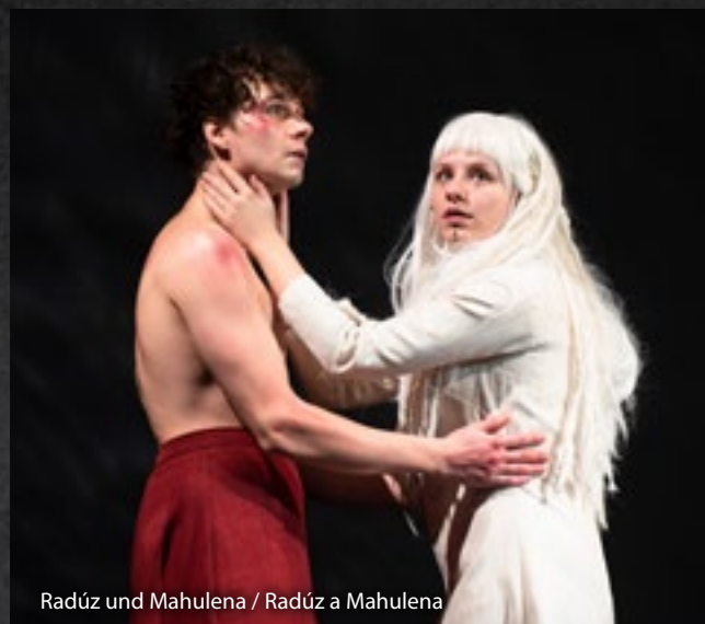
Radúz und Mahulena / Radúz a Mahulena