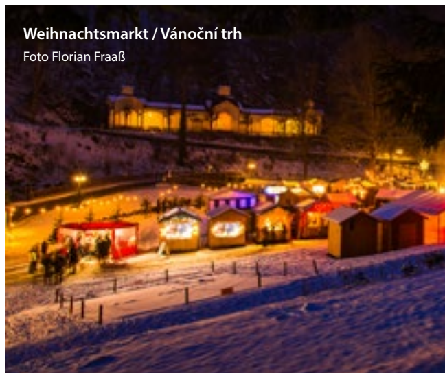
Weihnachtsmarkt / Vánoční trh

In direkter Nähe des Marktplatzes befindet sich mit der ev. Dreifaltigkeitskirche von 1800 die letzte erbaute Markgrafenkirche. Typisch für diesen Kirchenstil sind eine in den Altar integrierte Kanzel und ein Bau aus Sandsteinquadern. Die Kirche ist tagsüber für Besucher geöffnet.