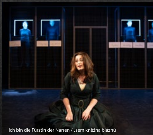
Ich bin die Fürstin der Narren / Jsem kněžna bláznů