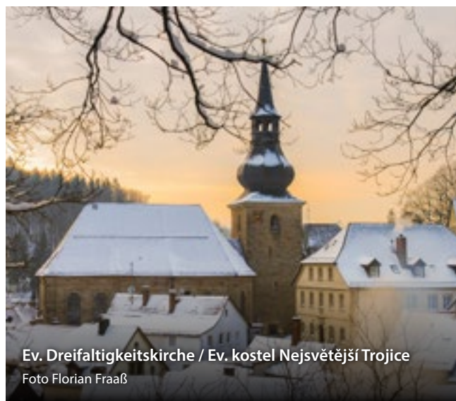
Ev. Dreifaltigkeitskirche / Ev. kostel Nejsvětější Trojice

Téma zdraví a prevence je v Bad Bernecku tradičně vysoce ceněno. Naše zdravotní centrum "Therapieloft Fichtelgebirge"