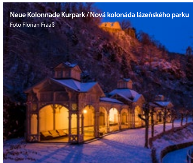
Neue Kolonnade Kurpark / Nová kolonáda lázeňského parku

Das Thema Gesundheit und Prävention wird in Bad Berneck traditionell hoch gehalten. Unser Gesundheitshaus „Therapieloft Fichtelgebirge“ bietet ganzjährig Kneippangebote und eine ganzheitliche Versorgung rund ums Thema Gesundheit an. Bad Berneck verfügt über die Tradition eines Kneippheilsbades. Auch heute kann jeder selbständig die fünf Säulen der Kneippschen Lehre anwenden. Zahlreiche Wanderwege sorgen auch im Winter für ausreichend Bewegung, liebevoll eingerichtete Ruhepunkte verhelfen zu innerer Balance und mehrere Gasthäuser versorgen ihre Gäste kulinarisch. In der Saison beherbergen artenreiche Wiesen zahlreiche Wildkräuter und mit zwei Wassertretbecken, mehreren Armbädern und zwei Flussrädern bleiben beim Thema Wasser keine Wünsche offen.