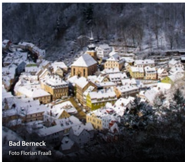
Bad Berneck

Nad náměstím se tyčí Starý zámek s unikátní hradní věží. Kaple Marienkapelle vděčí za své jméno svaté soše Panny Marie. Nad ní se nachází hrad Hohenberneck, který je ukázkovým příkladem přechodné stavby od hradu k paláci. Důvodem této nečekané rozmanitosti hradních komplexů je středověká obchodní cesta Via imperii, která vedla z Říma do Štětína právě středem Bad Bernecku. Toto jedinečné spojení přírody a kultury vás zve ke znovuoživení středověku.